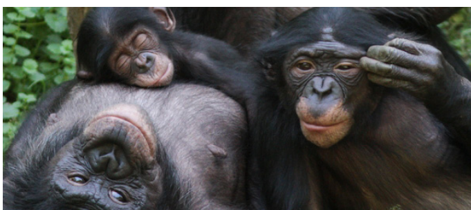
Bonobon löser konflikter och håller ihop gruppen genom: sex.