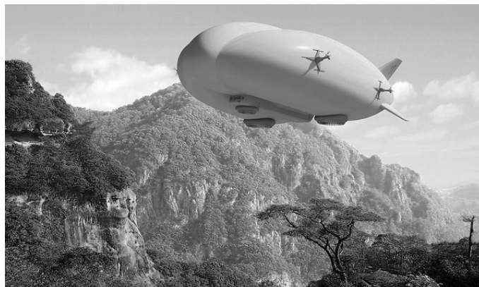
Luftskeppshybriden LMH-1, nu i produktion.

F ör tio år sedan provflög Lockheed Martin ett luftskepp - eller egentligen en hybrid mellan en zeppelinare, flygplan och helikopter. Under 2016 startar försäljningen av deras nya luftskepp.